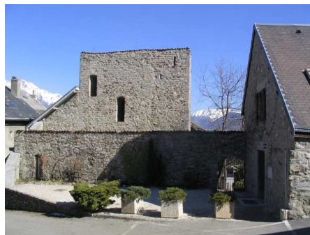
La Mure -Tour maison Carrale

Borne 8 : le patrimoine bâti et religieux