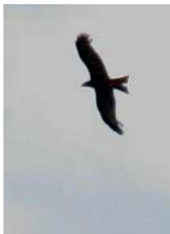
Milan noir en vol