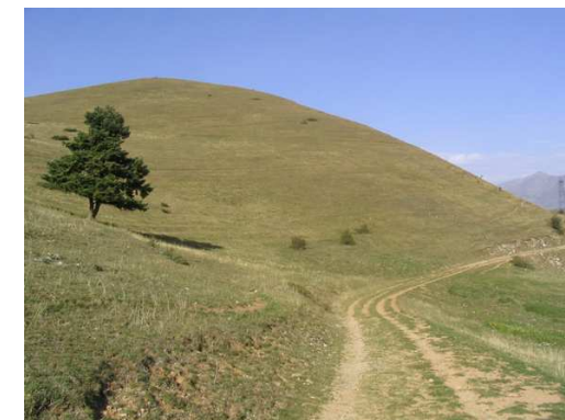
L'Alpage du Senépi